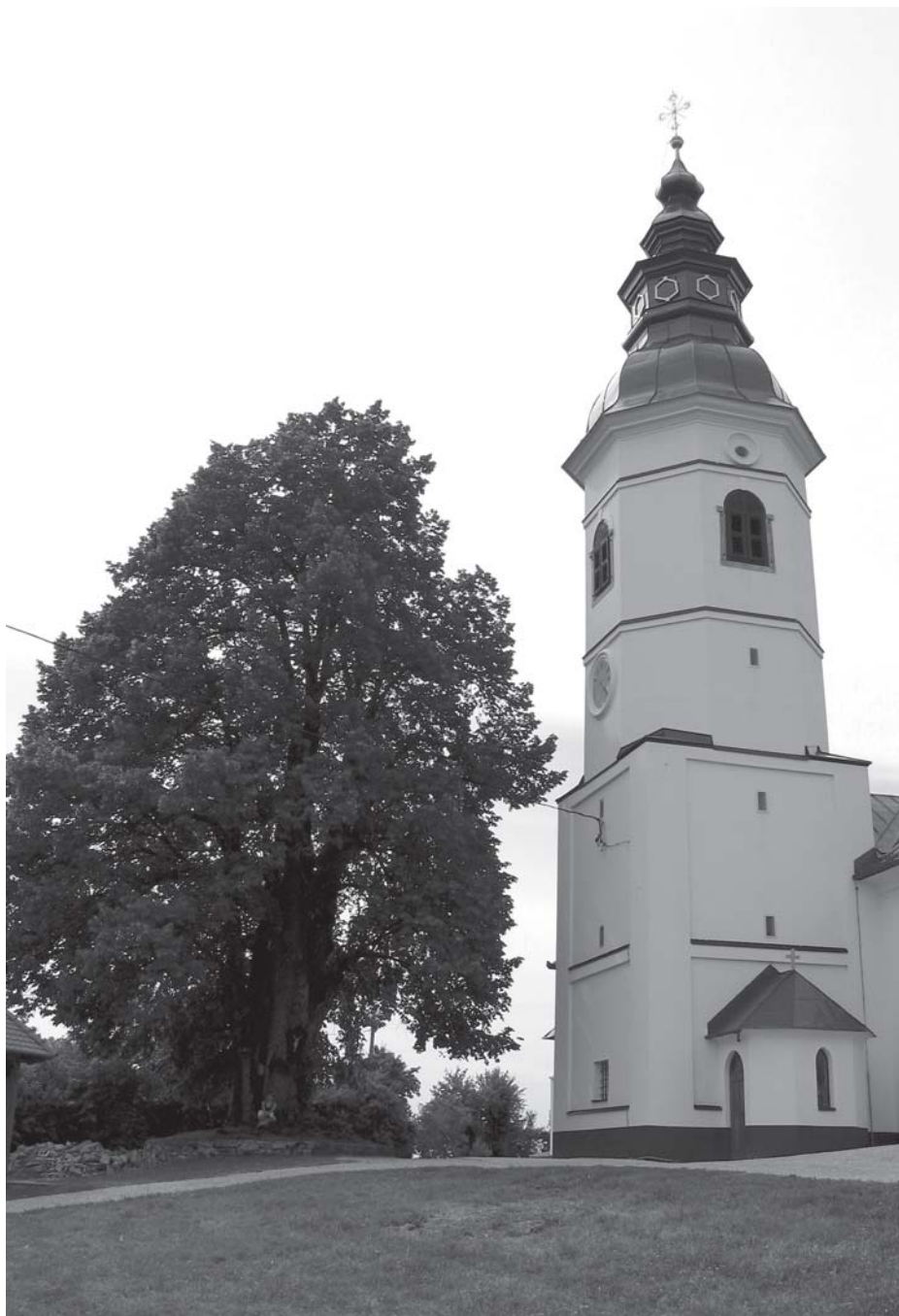
Cerkev in lipa na Primskovem, 2005