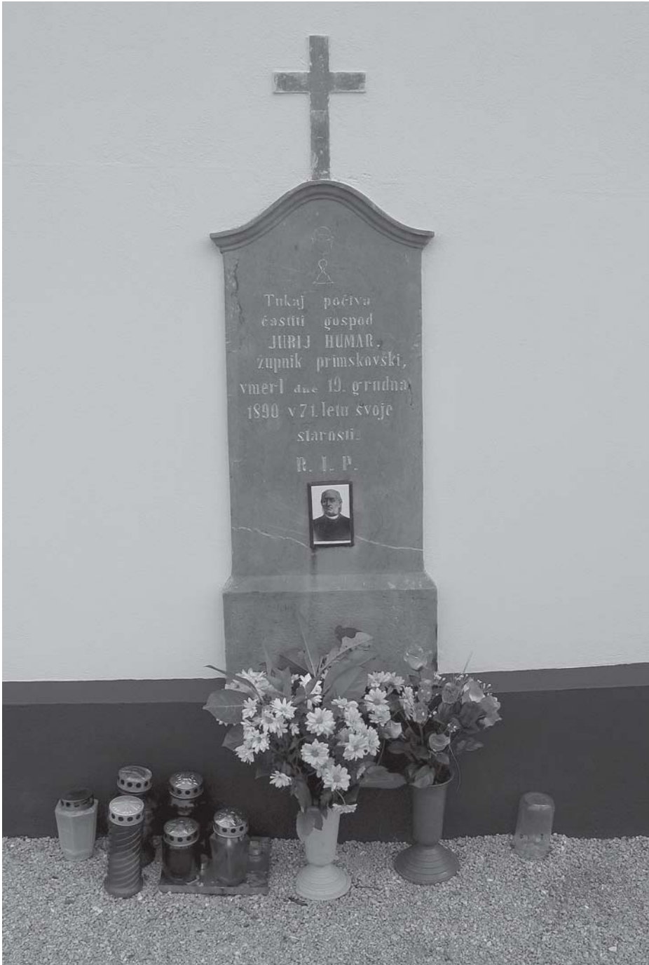
Nagrobnik Jurija Humarja ob cerkvi na Primskovem, 2005