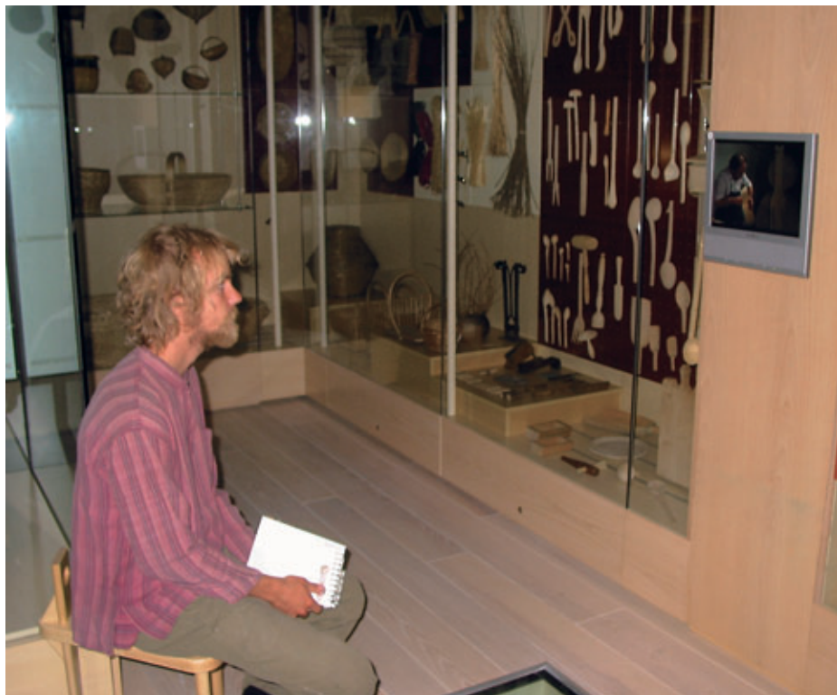
Kolaž Suhorobarstvo : obiskovalci radi izkoristijo stole, da si med ogledom odpočijejo noge.