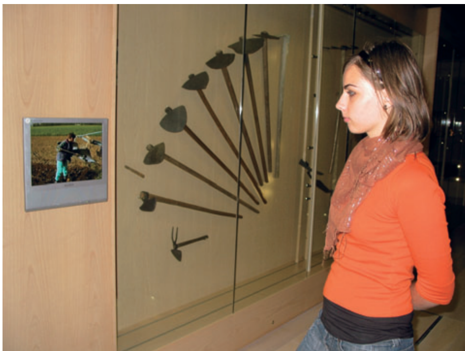
Kolaž Gojeni ekosistemi ob vitrini z motikami prinaša tako posnetke tradicionalne kot moderne obdelave zemlje. Ekran je montiran v višini oči, vendar upoštevamo tudi najmlajše obiskovalce.