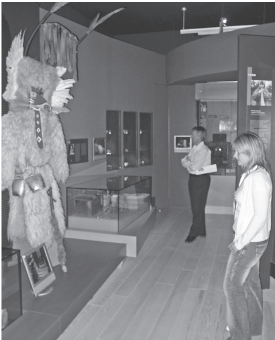
Trije ekrani v sobi Duhovno in socialno: na levi kolaž Pustovanje , na sredini Pirhi in na desni Žive jaslice . Foto: M. Habič, 2006