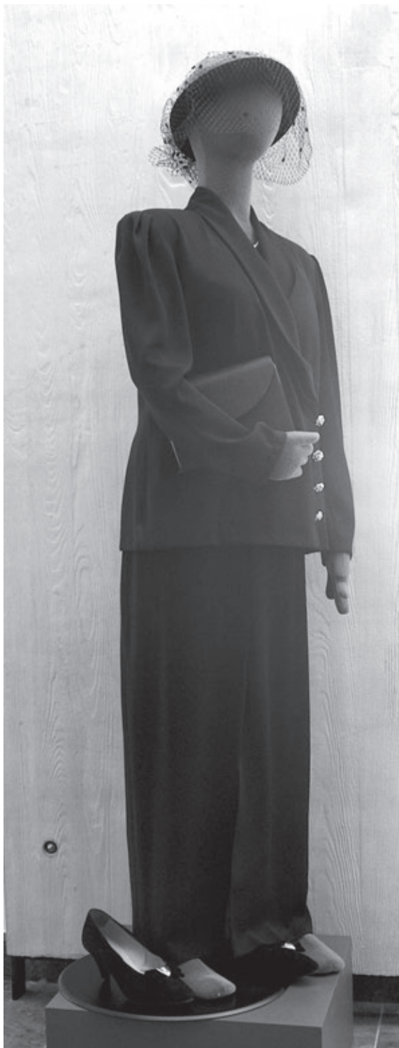
Slovesno oblačilo Štefke Kučan, prve dame Republike Slovenije, iz l. 1993, za sprejem pri papežu Janezu Pavlu II; predstavljeno je na stalni razstavi SEM.