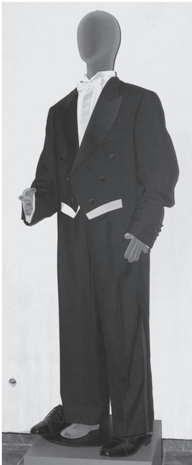
Frak , slovesno in protokolarno oblačilo Milana Kučana, predsednika Republike Slovenije, prvič v rabi l. 1993; predstavljeno na stalni razstavi SEM.