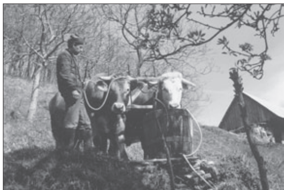
Napajanje volov Sivčeka (sivo-rjave pasme) in Šeka (simentalke pasme) na kmetiji "Pri Erjavc" v Reštajnu na Kozjanskem. Foto: Inja Smerdel, 2000