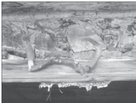
Volovski rogovi kot zaščita nad vrati govejega hleva kmetije "Pri Erjavc" v Reštajnu na Kozjanskem.