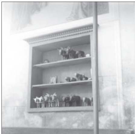
Votive figurice volovskih parov, vpreženih v jarem, v cerkvi na Brinjevi gori pri Zrečah na Štajerskem. Foto: Pavla Štrukelj, 1965

SKRB ZA KOPITA. Slovenski kmetje so se zavedali pomembnosti zdravih kopit svojih vprežnih živali za njihovo splošno zdravje; saj, kot je zapisal Bleiweis (1851: 3), “se včasih bolezen iz kopita po celim truplu razširi” (ali pa iz “trupla v kopito vdari”). Pogostnost podkovanja je bila odvisna od parkljev (in ti povečini od pasme), od poti, po katerih so voli stopali, in od del, katera so opravljali. Zaradi mehkih parkljev za delo niso najbolj cenili lisastih volov (iz populacije švicarskega simentalskega goveda), toliko bolj pa so bili kot delovne živali cenjeni slovenski sivorjavi voli, tako imenovano montafonsko govedo, in belosivi istrski voli. Glede načinov podkovanja – na osem podkev, na vse parklje; le na zunanje, “na štiri”; na prve noge na vse štiri, na zadnje noge le na zunanje parklje – so imeli kmečki gospodarji vsak svoje odtenke splošnih znanj in modrosti. Številni kovači so imeli za podkovanje nemirnih volov vsaj od sredine 19. stoletja dalje posebne “štande” oziroma – po Bleiweisu (1851: 61) – tako imenovano kovavno ograjo ali nemško Nothstand. (Čeprav o tem zaenkrat niso znani neposredni viri, je povsem mogoče sklepati o uveljavitvi tako imenovanega “Maréchal ferrant et opérant” 17 v času Napoleonovih Ilirskih provinc.)