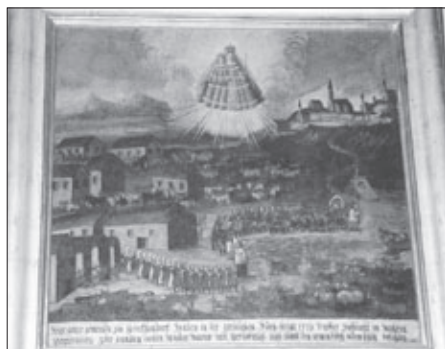
Votivna slika, ki predstavlja čudežno uslišanje prebivalcev Župeče vasi na Dravskem polju ob času živinske kuge, z letnico 1779. Visi nad vrati zakristije romarske cerkve na Svetih gorah.