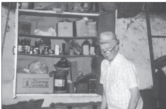
Gospodar dolenske kmetije "Pri Hrenovk" pred nekdanjo "domačo lekarno" za živino v gospodarskem posloplju v Hočevju nad Krko. Foto: Inja Smerdel, 2006