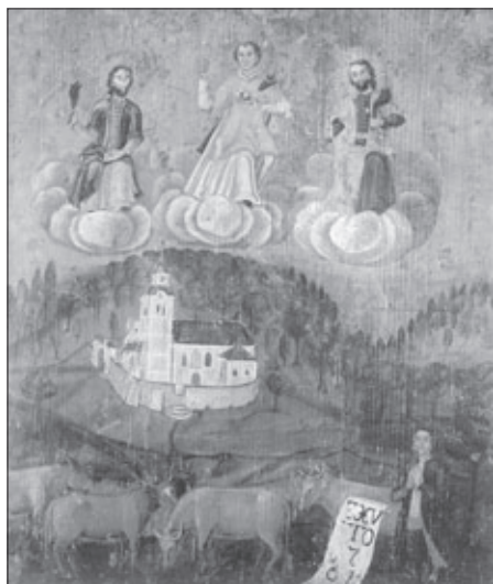
Votivna slika zavetnikov sv. Štefana, Kozme in Damijana z letnico 1764. Olje na les, iz zbirke SEM.