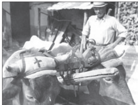
Križ kot zaščita na blazini v igo vpreženih krav v Kalu pri Kobaridu. 1952

USTREZNOST VPREGJE. Na slovenskem ozemlju sta bili za vpreganje delovnih volov uveljavljeni obe temeljni obliki jarma v evropskem kulturnem prostoru in drugod: jarem za vleko z glavo (franc. joug de cornes , ang. head yoke ) oziroma čelni jarem ali igo (na severnem delu Gorenjskega ter na Koroškem) in jarem za vleko z vratom (franc. joug de garrot ). Slednji pri nas pozna dve različici: tako imenovani sredozemski jarem s kambama (ang. bow yoke ), ki je sporočen za Primorsko, Notranjsko, osrednji del Dolenjskega in Štajerskega, ter tako imenovani slovanski jarem ali telége (ang. frame yoke ), sporočen za vzhodni del Dolenjskega in Štajerskega. Ponekod sta enovit dvojni jarem vsaj v prvi polovici 20. stoletja nadomestila dva enojna jarmiča in v teh krajih so menili, da je "lažje delala žival vsaka zase; en vol je bil zmeri lahko malo bolj živ – ko človek" (Smerdel 2005: 368). Ta preskok v tehniki vpreganja je bil morda pozen odmev številnih besedil, ki so na temo mučenja in neustreznega vpreganja živine izhajala v 19. stoletju (v Novicah ) in propagirala enojno vpreganje v komate, podobne konjskim. Veterinar Bleiweis (1871: 66) je o tem zapisal, da jarmi za vleko z glavo vola preveč "trpinčijo ..., mora vse z glavo vleči". Pri tem ne more popolnoma napeti svoje moči in kri mu udarja v možgane. Za zdravje delovne živine najbolj ustrezna vprega je bil zanj nepreklicno komat. Otiske zaradi jarmov so najpogosteje mazali z oljem.