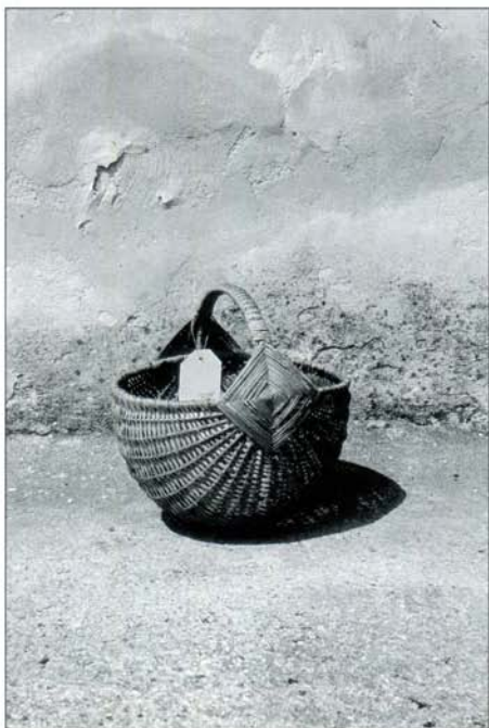
Košara za borovnice.