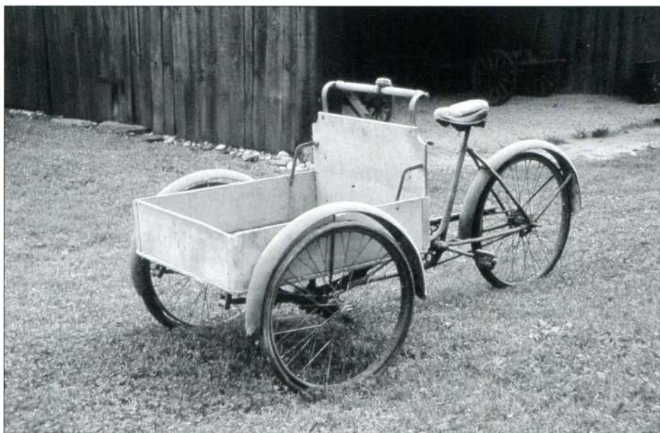
Tricikel za razvažanje mleka. Foto: Inja Smerdel, 2006