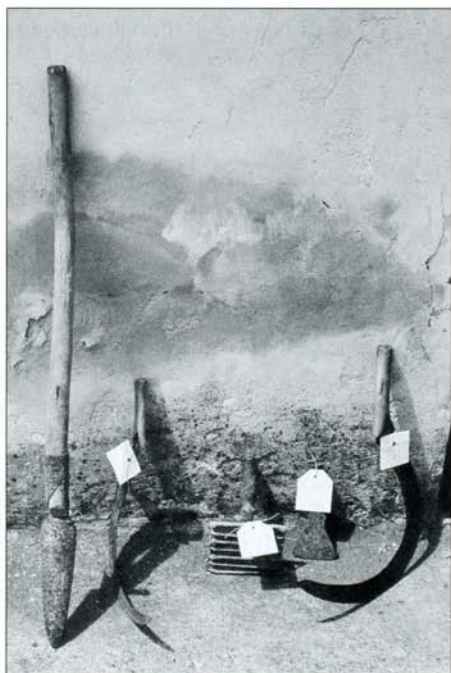
Klin za sajenje okopavin, dva srpa za žetev, "štrigla" za konja in otka. Foto: Inja Smerdel, 2006