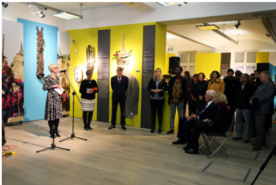
Odprtje razstave Afrika in Slovenija: preplet ljudi in predmetov

2011 Muzeji in družbeno vključevanje: primer razstave o brezdomstvu v Slovenskem etnografskem muzeju. Etnolog 21, str. 245–261.