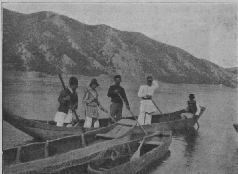
Polazak na garde iz sela Sipa.

ili prodaju još sveže, ili ga usole, ili pak naprave od njega marinat. Manje ribe obično prodaju kao sveže, ili ih takođe usole i tako prodaju. Ribolov na gardama, i u opšte, na Donjem Dunavu nije svake godine izdašan. Sledeći primer pokazuje kakav je bio ribolov u međuvremenu od 1919—1924. godine u okolini Kladova. (M. Savić: Naša Industrija, Zanati i Trgovina, deo V., strana 90.)