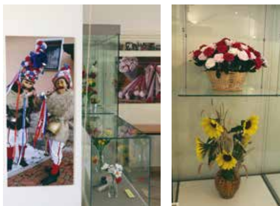
Utrinek z razstave Tradicionalno izdelovanje papirnatih rož