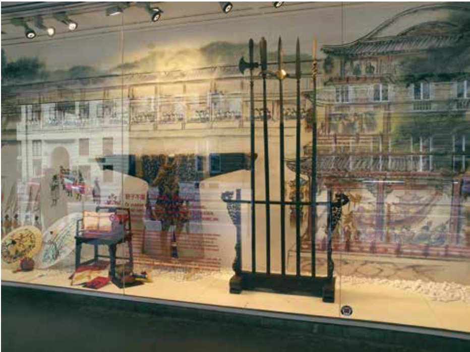
Izložbeno kitajsko okno, blagovnica Nama Ljubljana. SEM se predstavlja z izbranimi predmeti iz svoje kitajske zbirke, april–maj 2014

V letu 2014 je SEM poudarjal predvsem pomen muzejskih zbirk in njihove dostopnosti čim širšemu krogu občinstva ter si prizadeval za usmeritev k še kompleksnejšemu družbenemu uresničevanju muzejskega poslanstva. Te cilje je uresničil s pomočjo pluralističnih pristopov in v sodelovanju s številnimi tako muzejskimi kot zunanji nosilci v raznovrstnem in obsežnem programu razstav in drugih dejavnosti.