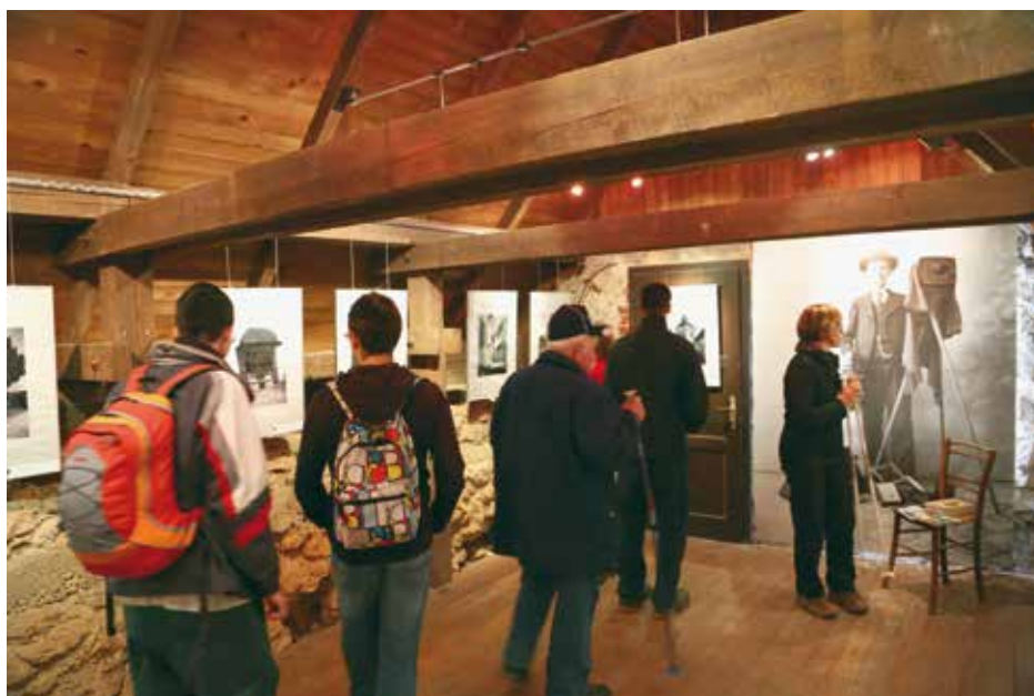
Utrinek z razstave Družinsko romanje na Šmarno goro, Fotopis Petra Nagliča iz leta 1933

MAGIJA EGIPTA (22. november 2014–18. januar 2015, Museum Archeologico Siracusa) (10. Oktober–10. november 2014, Regional Museum Agostino Pepoli, Trapani)