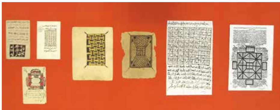
Utrinek z razstave Magija amuletov – talismani