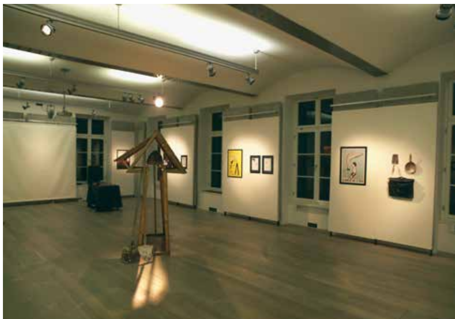
Utrinek z razstave Pozor, delo!

(Produkcija: Stripburger/Forum Ljubljana, koprodukcija: Slovenski etnografski muzej)