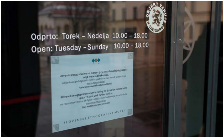
Pogled na vhodna vrata muzeja od 13. marca do 4. maja 2020

Sodelavci Slovenskega etnografskega muzeja (SEM) smo, tako kot še mnogi drugi, svoje pisarne preselili v svoje domove in se »srečevali« 1 prek računalniških ekranov. Za skoraj dva meseca je to postala naša realnost. Čeprav je bil muzej fizično zaprt, smo se želeli približati našim obiskovalcem in jim ponuditi različne vsebine. Svojo dejavnost smo preselili na spletno stran in socialna omrežja. Eden od projektov, ki se nam je porodil ob razmišljanju, kako tudi obiskovalce oz. uporabnike vključiti v aktivnosti, je projekt z naslovom »KDO SEM v času pandemije?«. Povezuje se s stalno razstavo SEM Jaz, mi in