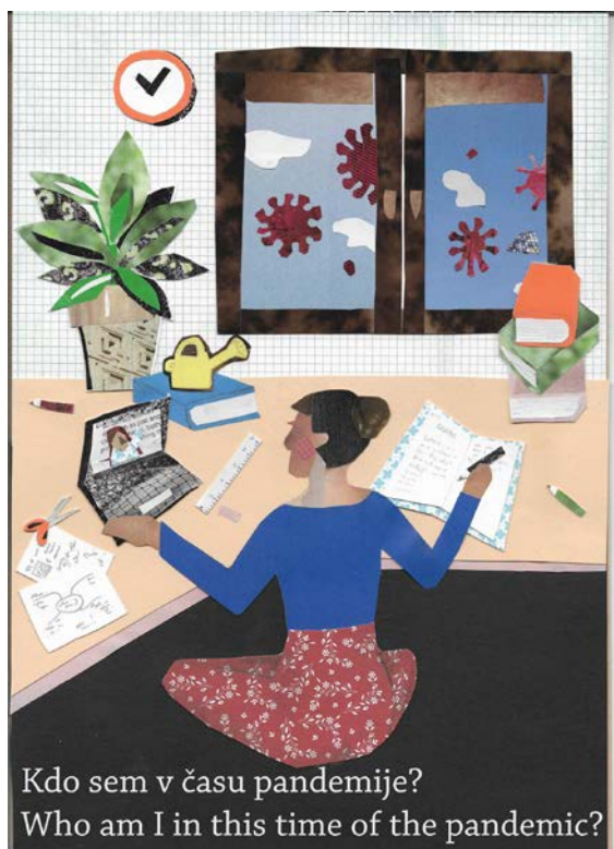
Naslovnica elektronskega zbornika Kdo sem v času pandemije? / Who am I in this time of the pandemic? (posnetek zaslona)

K projektu je lahko s svojim prispevkom pristopil prav vsak, ne glede na to, v katero starostno skupino spada in kakšna je njegova družbena vloga. Posebej pa smo si želeli, da bi se na poziv odzvali družbeni skupini, za kateri menimo, da ju je epidemija še posebej močno zaznamovala; to so mladi, dijaki in študentje, ki so bili prisiljeni ostati za štirimi stenami v krogu svoje družine, brez socialnih in fizičnih stikov s svojimi vrstniki in ob izobraževanju na daljavo, ter starostniki in starejši v tretjem življenjskem obdobju, ki so ostali še bolj sami, se na neki način morda spoznali z uporabo sodobnih tehnoloških